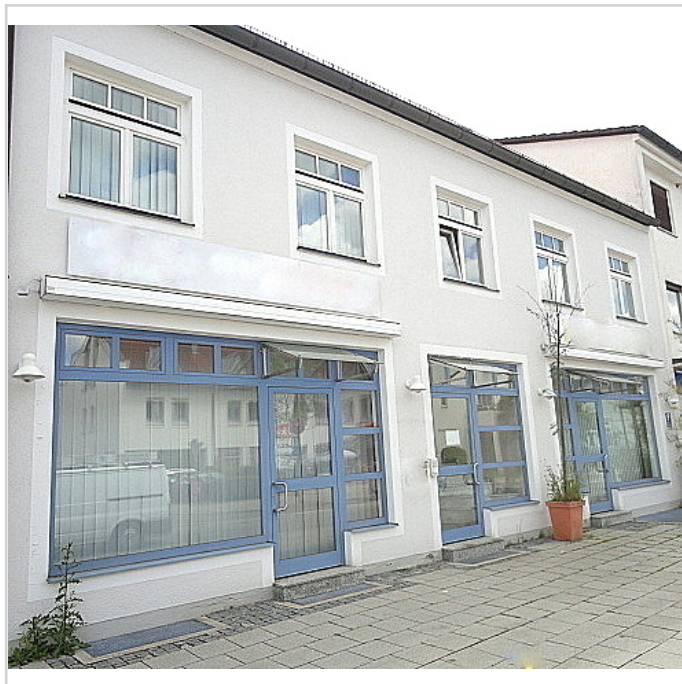
Büro im ersten Stock